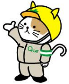
Q-CATマスコットキャラクター Q太くん

自動セットの保険制度であるため、工事ごとの保証書は発行されません。事故発生時に、認定品の適切な使用が確認された場合に保険金が支払われます。